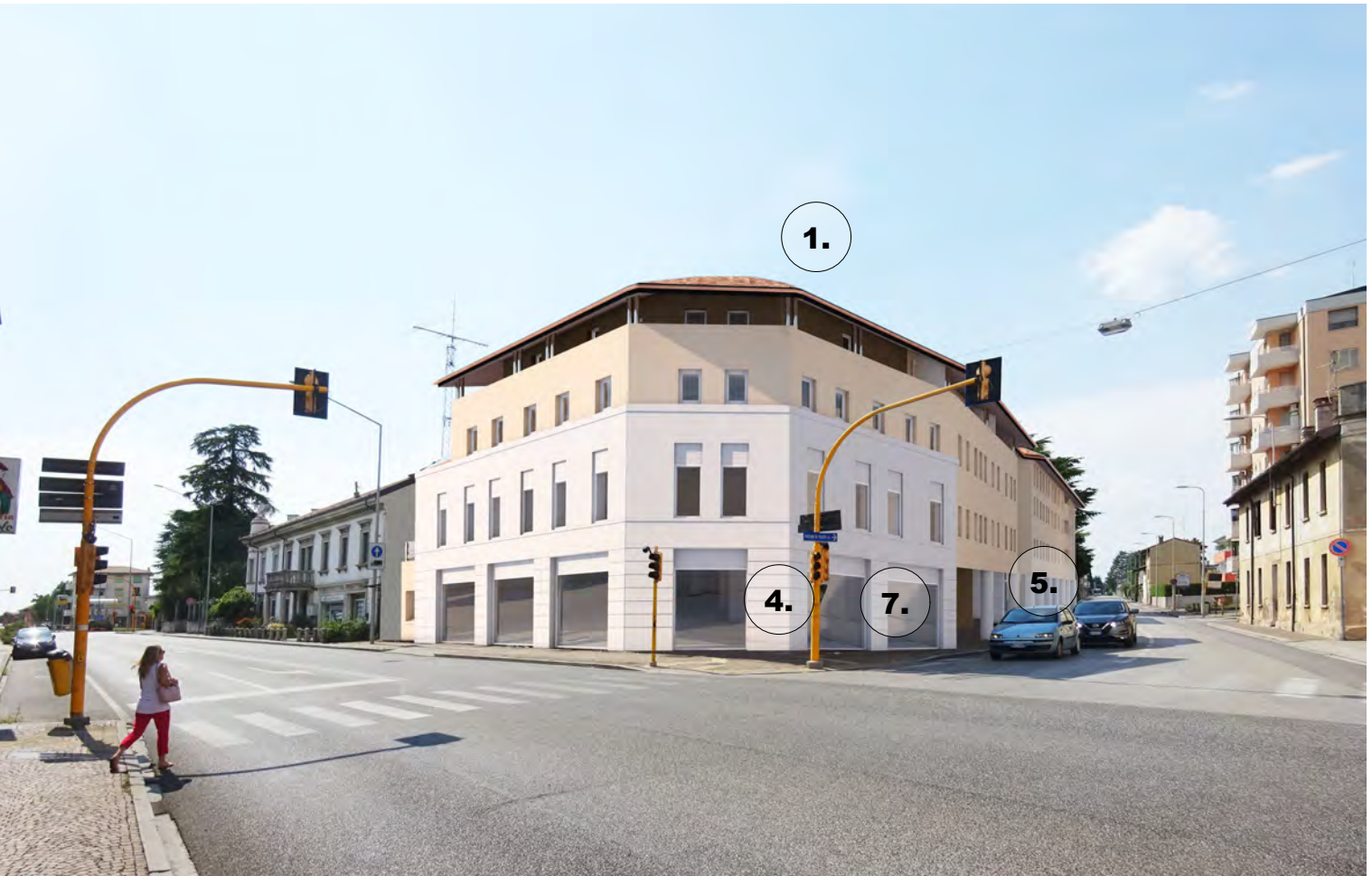
VISTA INCROCIO VIA CAMPOFORMIDO - VIA ROMA - SDP