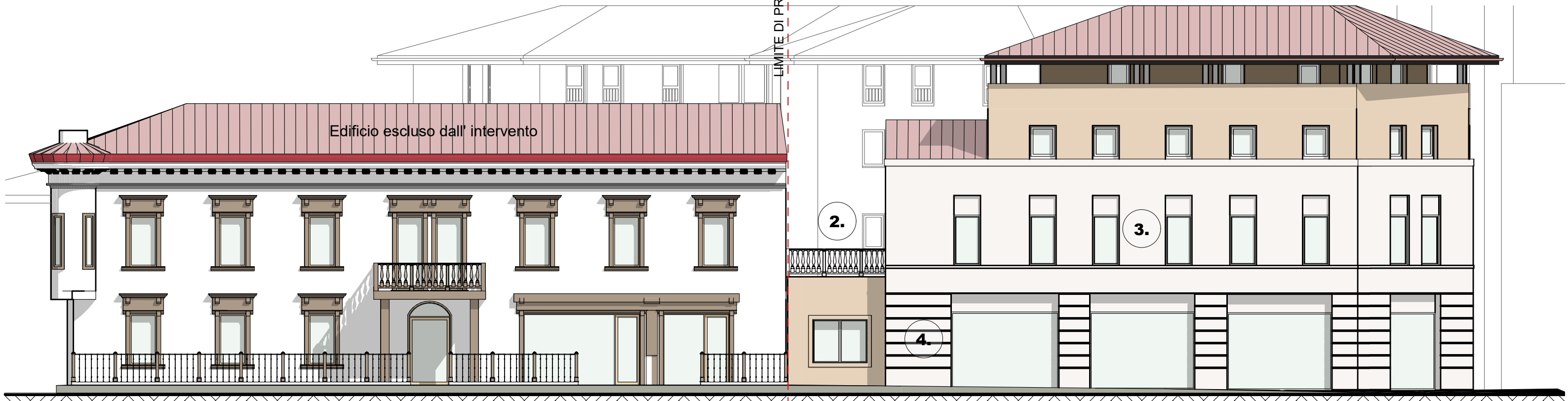
PROSPETTO SUD 1:150