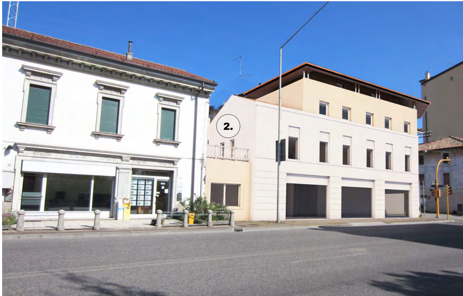
VISTA PROSPETTO SU VIA CAMPOFORMIDO - SDP