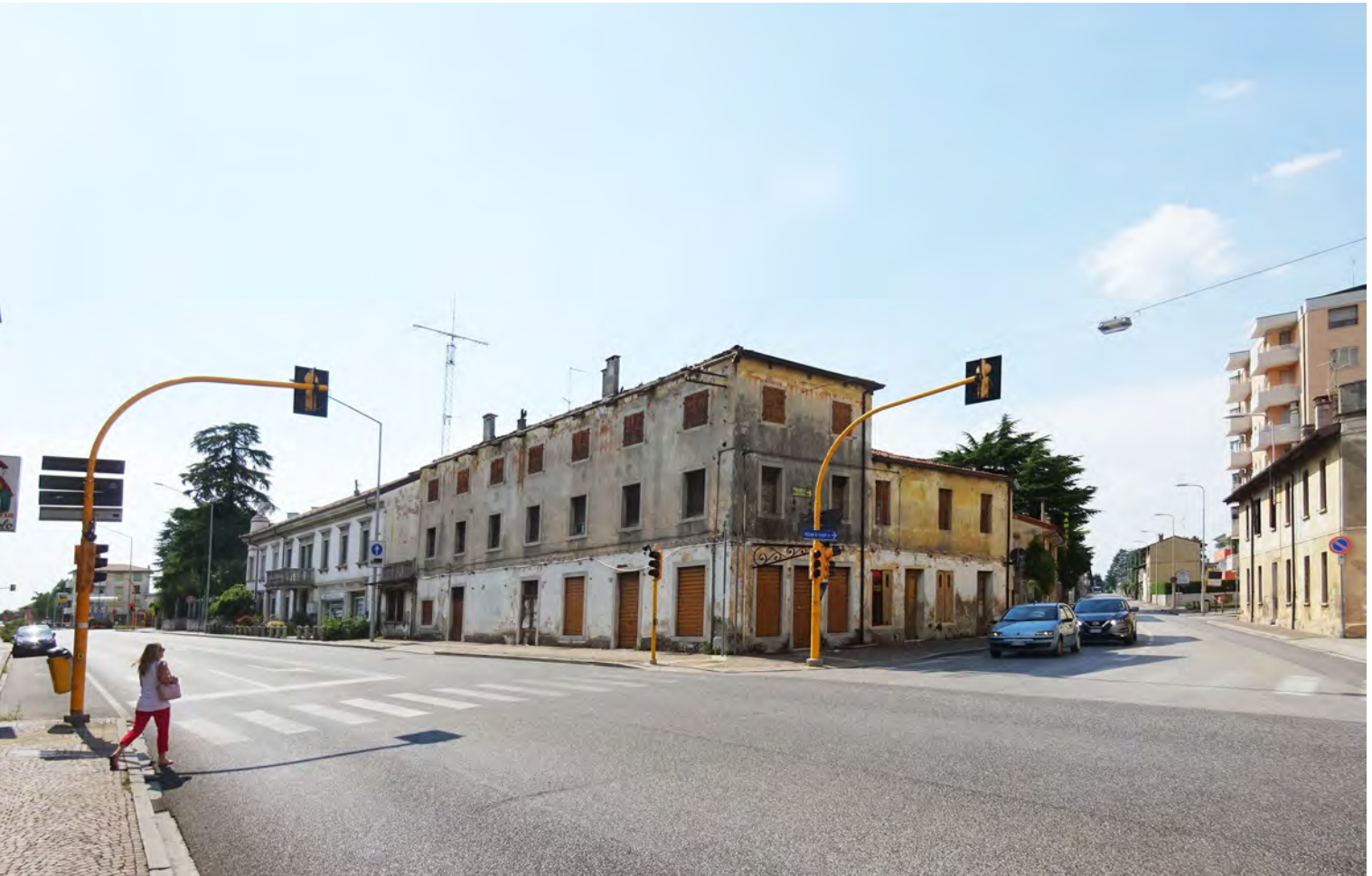
VISTA INCROCIO VIA CAMPOFORMIDO- VIA ROMA - SDF