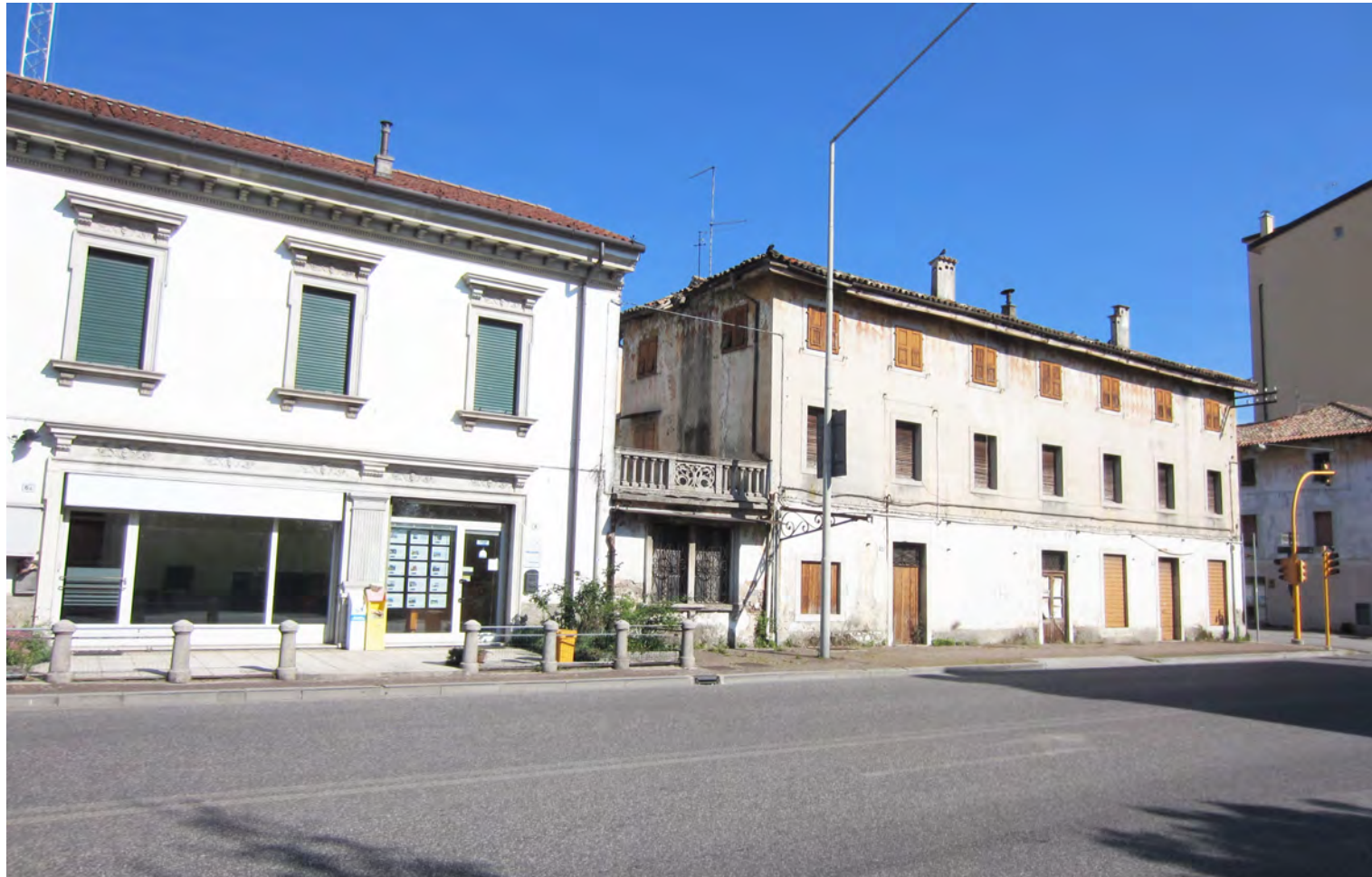
VISTA PROSPETTO SU VIA CAMPOFORMIDO - SDF