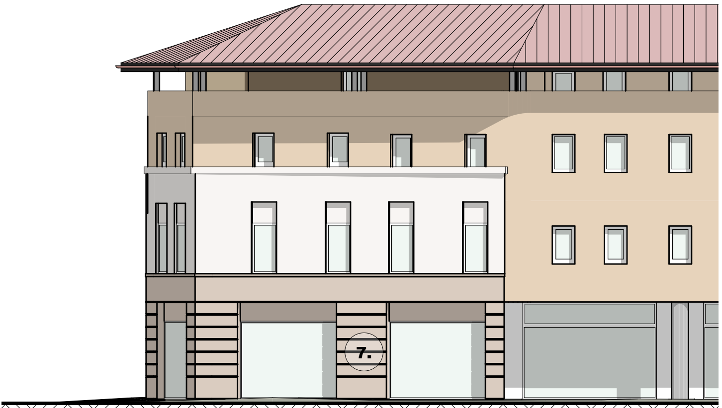
PROSPETTO EST 1:150